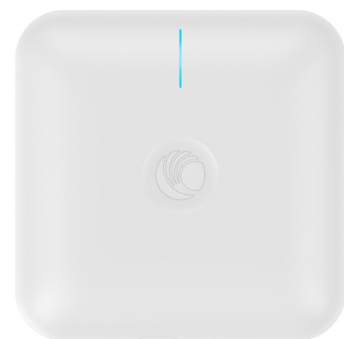
cnPilot e410 Enterprise Indoor Access Point

Intégrant un portail captif gérant les accès au réseau sans fil, la plate-forme permet notamment à Buffalo Grill de définir les étapes du parcours utilisateur, la page d'identification, le questionnaire de satisfaction, etc. lors de chaque connexion. Elle permet aussi d'établir des statistiques sur le volume de trafic et le profil de la clientèle (âge, genre, pays d'origine, etc.).